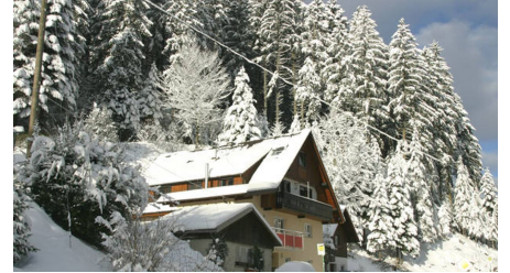
Hausansicht im Winter