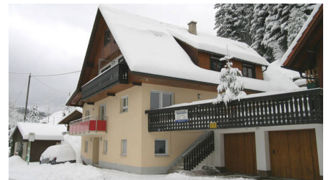
weitere Winteransicht