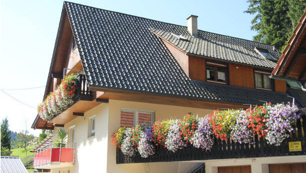
Hausansicht im Sommer