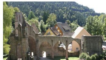
Ruine des früheren Prämonstratenser-Klosters in Oppenau-Allerheiligen