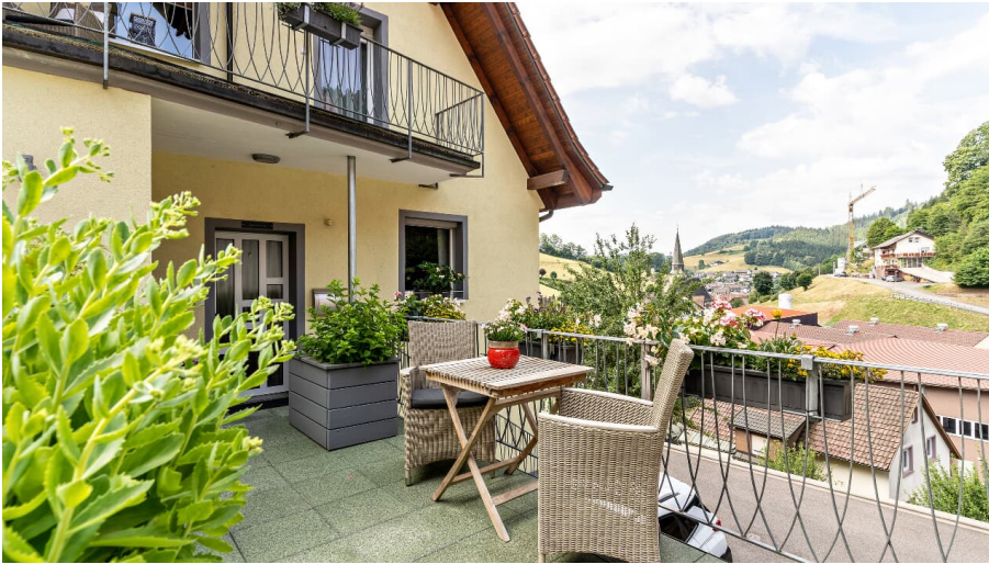
OUTSIDE, INSIDE