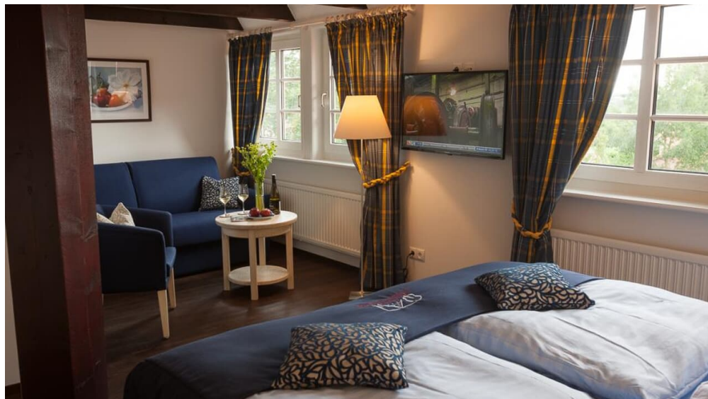
Beispielzimmer im Stammhaus

Auch mit öffentlichen Verkehrsmitteln ist eine Anfahrt möglich. Sie gelangen aus Richtung Hamburg zum Hotel. Beispielsweise mit der Fähre Linie 62 ab Hamburger Landungsbrücken bis nach Finkenwerder, von dort mit dem Bus nach Jork. Auch aus den Hansestädten Stade und Buxtehude gelangen Sie mit öffentlichen Verkehrsmitteln zum Hotel.