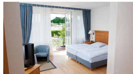
Beispielzimmer im Gästehaus