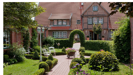
Gästehaus des Hotels im Altländer Stil, Blick auf den idyllischen Innenhofbuchsbaumgarten