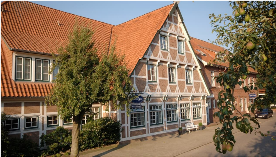
Hotel und Restaurant im modernen Fachwerkhaus