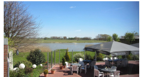
Die Terasse