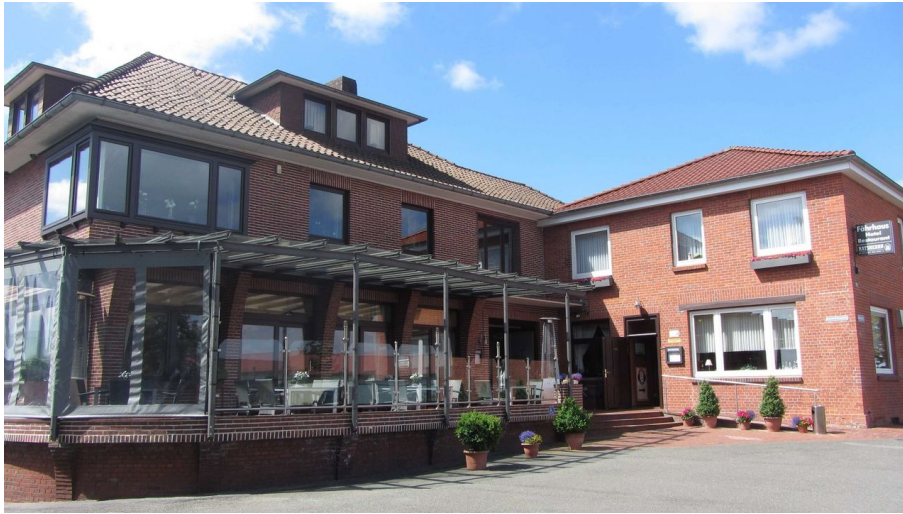
Fährhaus Wischhafen