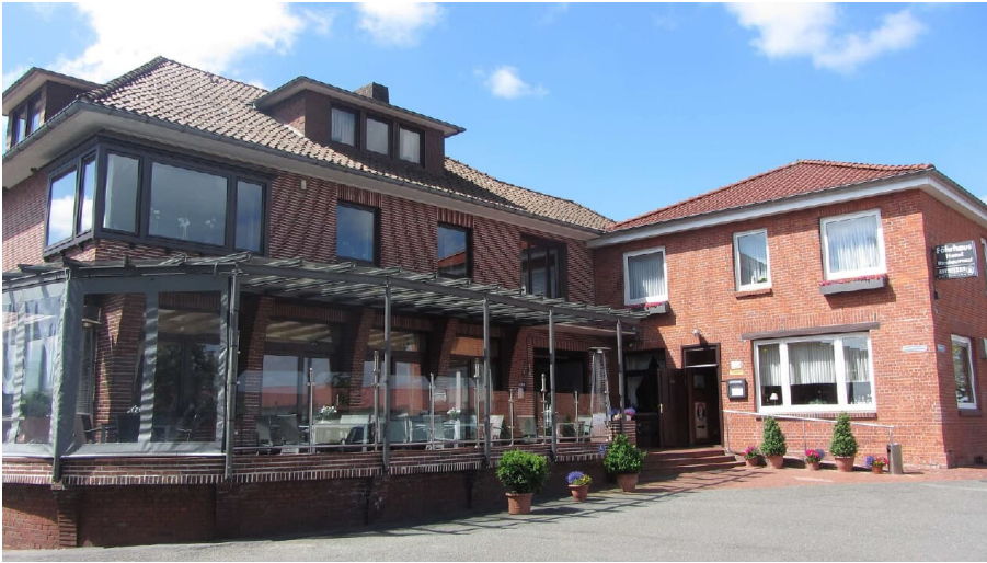
Fährhaus Wischhafen