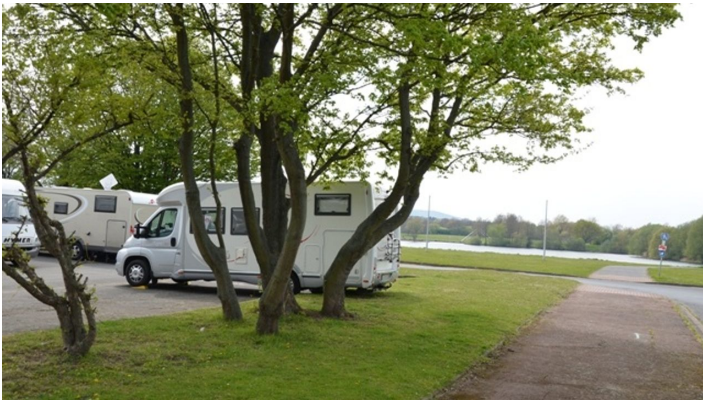
Reisemobilstellplatz am Salzgittersee

Die nächstgelegene Bushaltestelle ist Salzgitter-Lebenstedt, Hallenbad der KVG-Busse. www.regionalverband-braunschweig.de