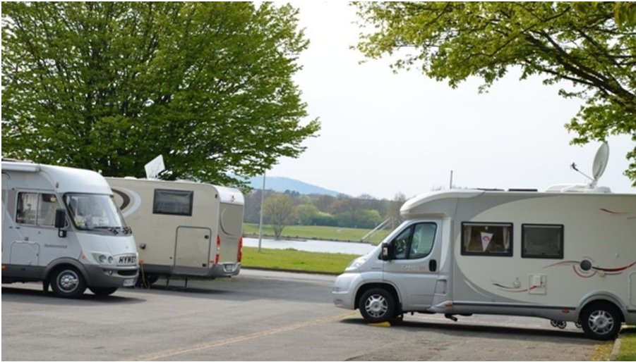
20 Stellplätze auf dem Reisemobilstellplatz am Salzgittersee