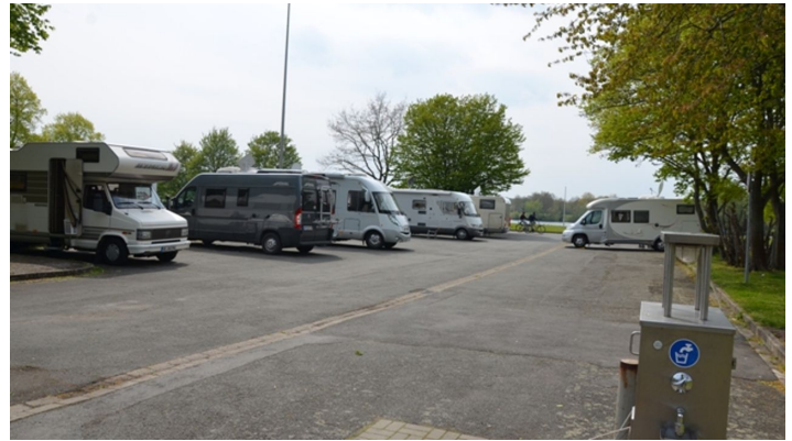
Versorgungsstation am Reisemobilstellplatz am Salzgittersee