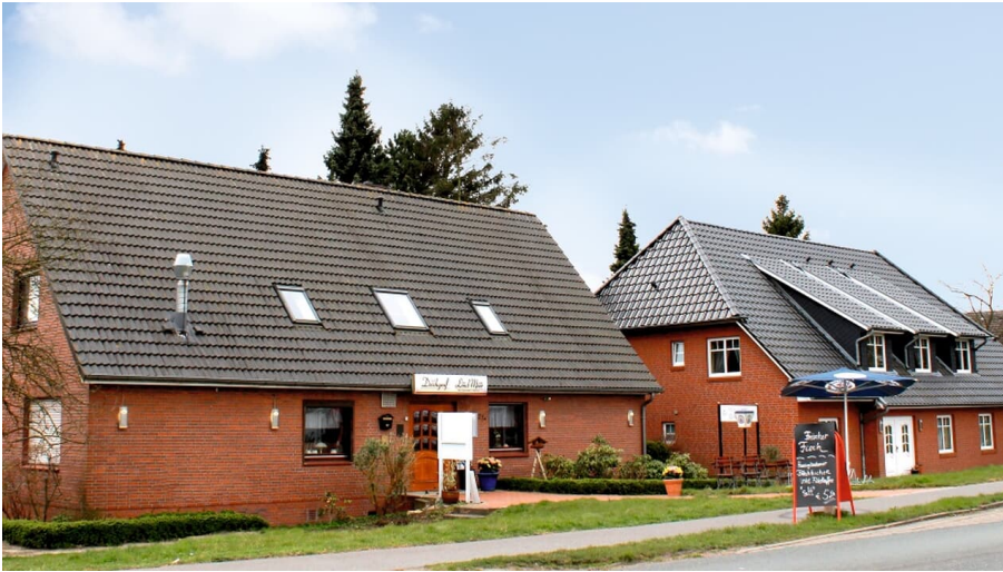
Außenansicht Restaurant und Hotel "Vom Land zum Meer"