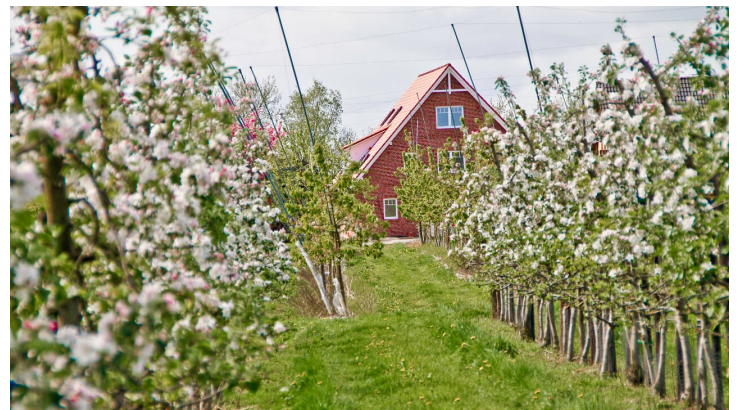
Apfelblüte auf dem Apfelhof Wegener