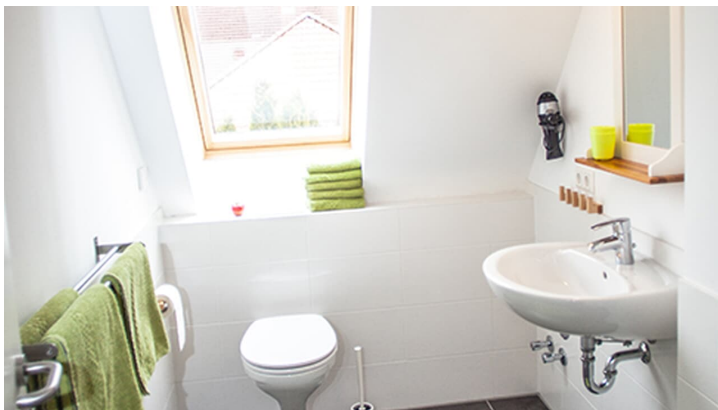
Impression Bad