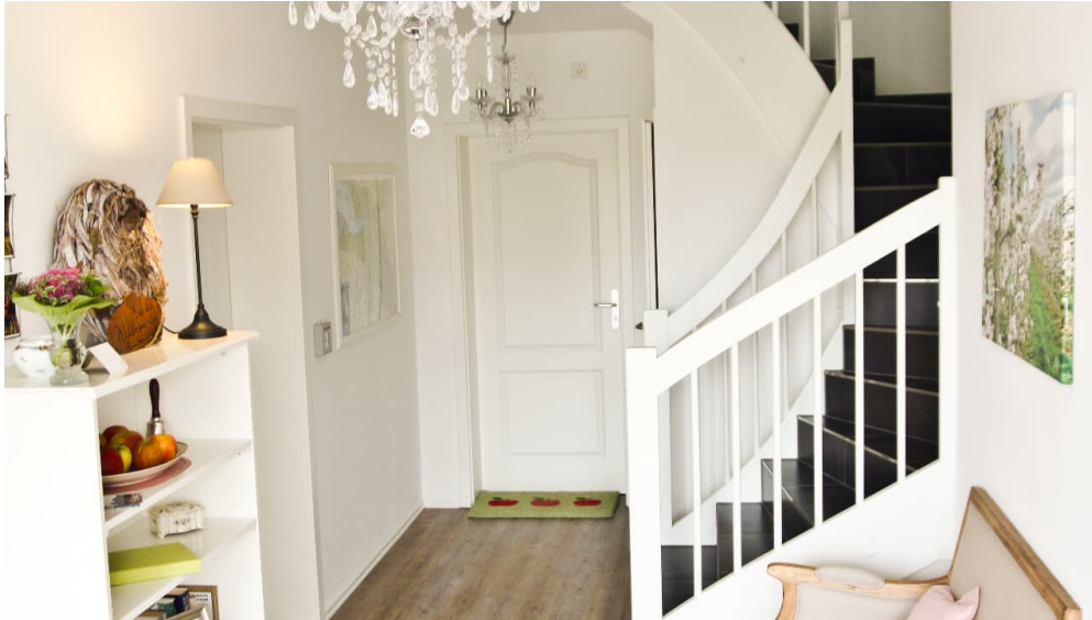
Impression Apfelhof Wegener