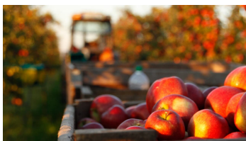
Apfelernte auf dem Obsthof