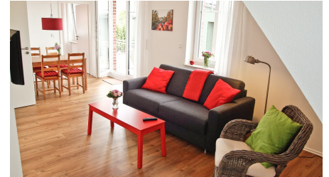
Wohnbereich Ferienwohnung Braeburn