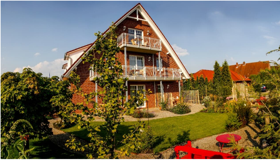
Panorama Apfelhof Wegener