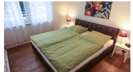
Schlafzimmer Ferienwohnung Holsteiner Cox