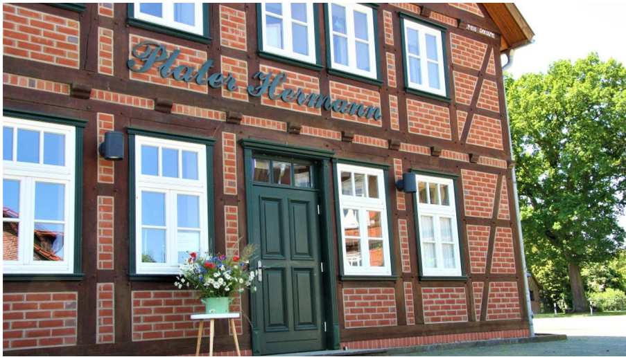
Plater Hermann