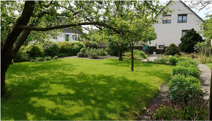
Ferienwohnung Wendland-Erholung