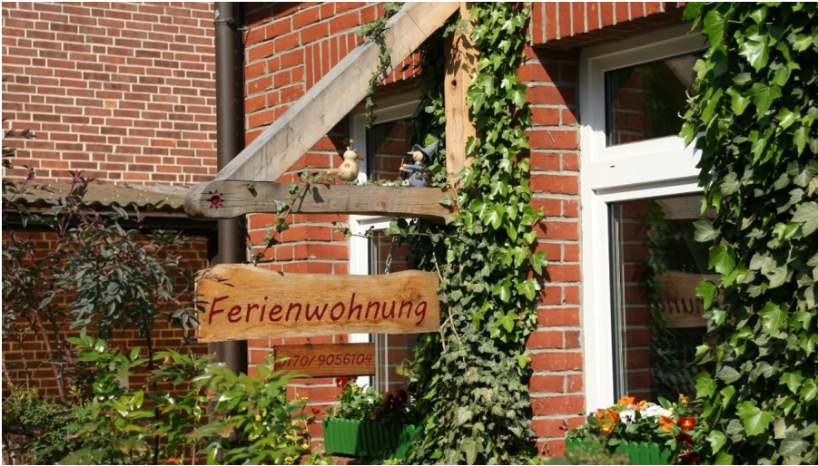
Ferienwohnung Prior - © Renate Prior, Urlaubsregion Wendland.Elbe