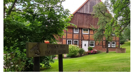
Eselhof Teut CC BY-SA - Sievers.jpg