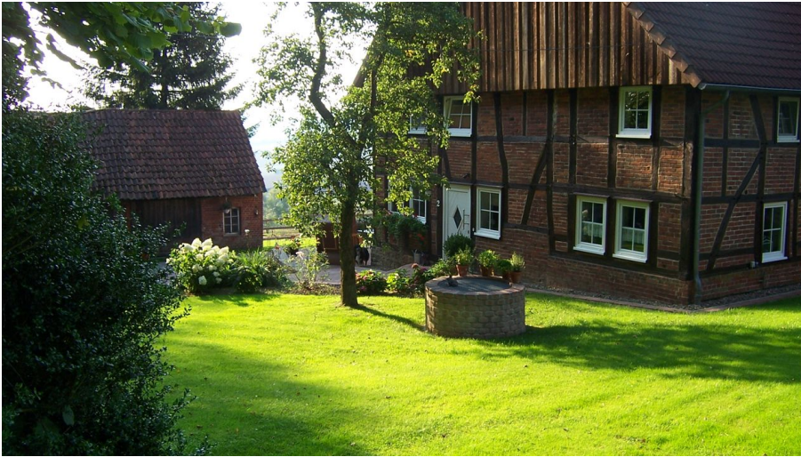
Eselhof Teut