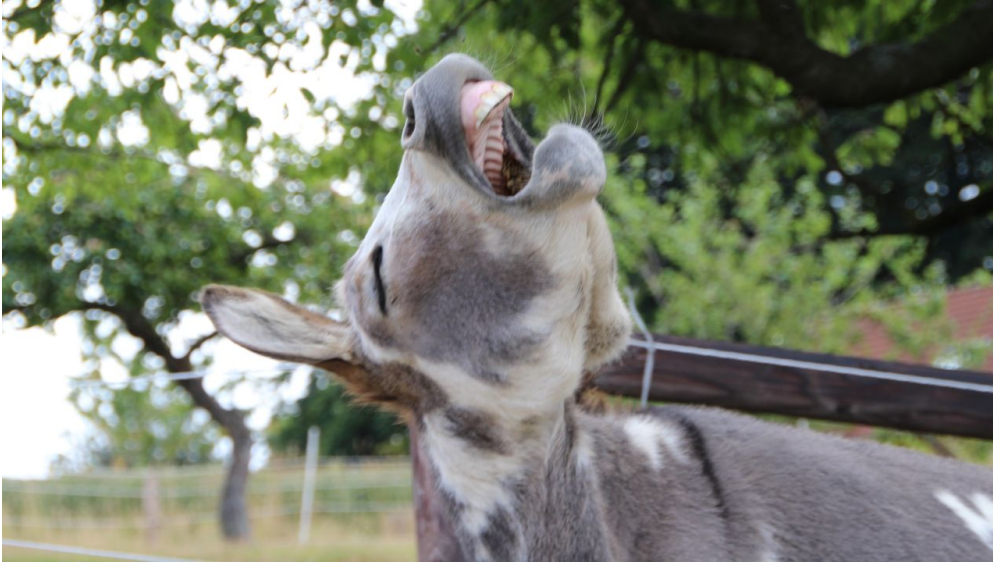
Esel CC BY-SA - Teut.JPG