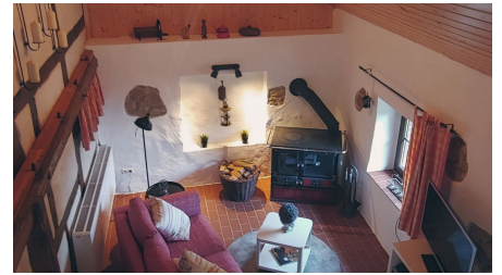
Teut Wohnbereich mit Kaminofen