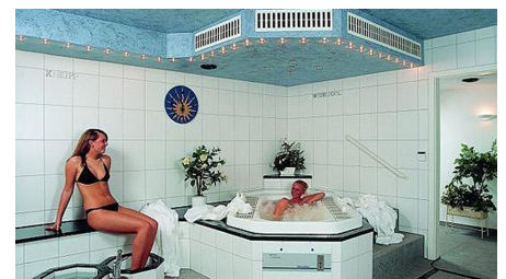
Beauty und Wellness