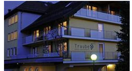
Aussenansicht am Abend