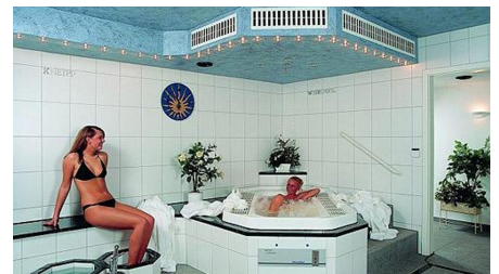
Beauty und Wellness