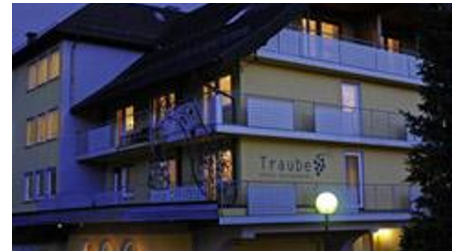
Aussenansicht am Abend