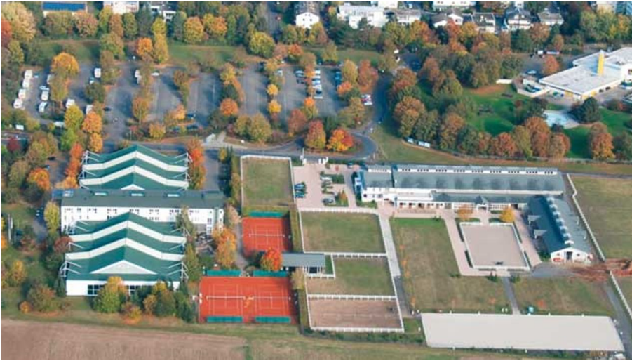
Campus Sportklinik Bad Nauheim - Luftansicht