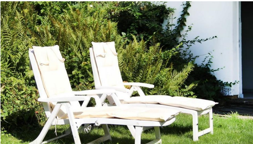
Liegemöglichkeit im Garten