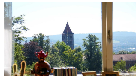
Aussicht aus dem Frühstücksraum