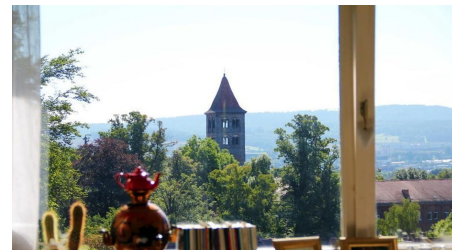
Aussicht aus dem Frühstücksraum