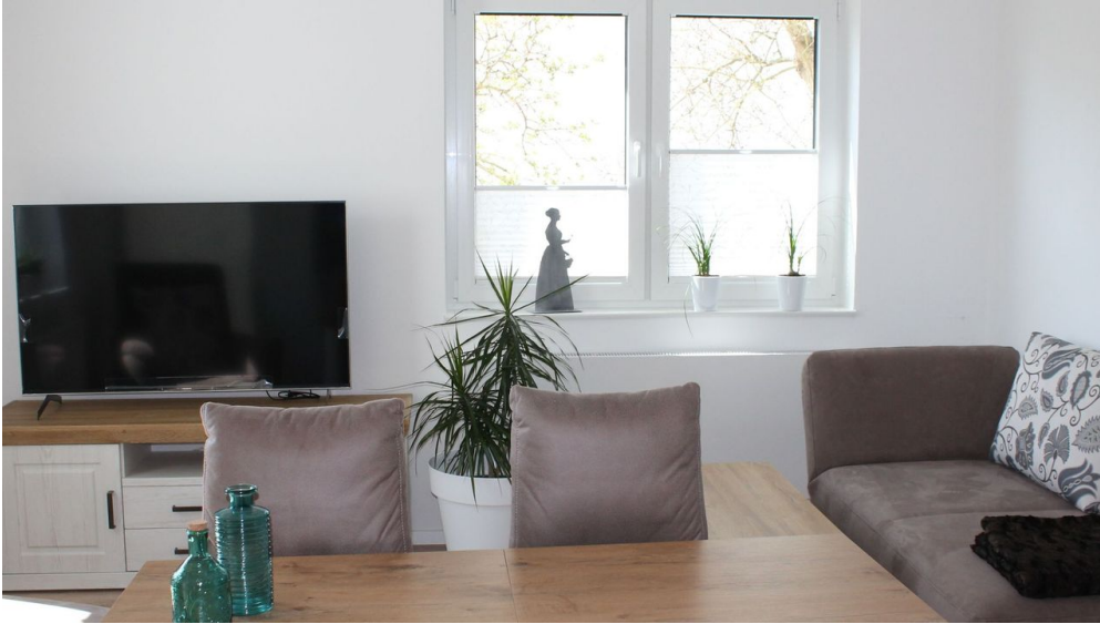
Wohnbereich - © im-web.de/ Staatsbad Bad Wildungen GmbH/Stadt Bad Wildungen