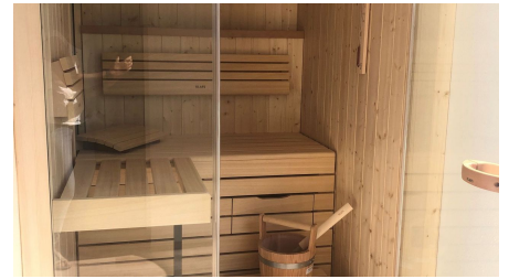
Sauna - © im-web.de/ Staatsbad Bad Wildungen GmbH/Stadt Bad Wildungen