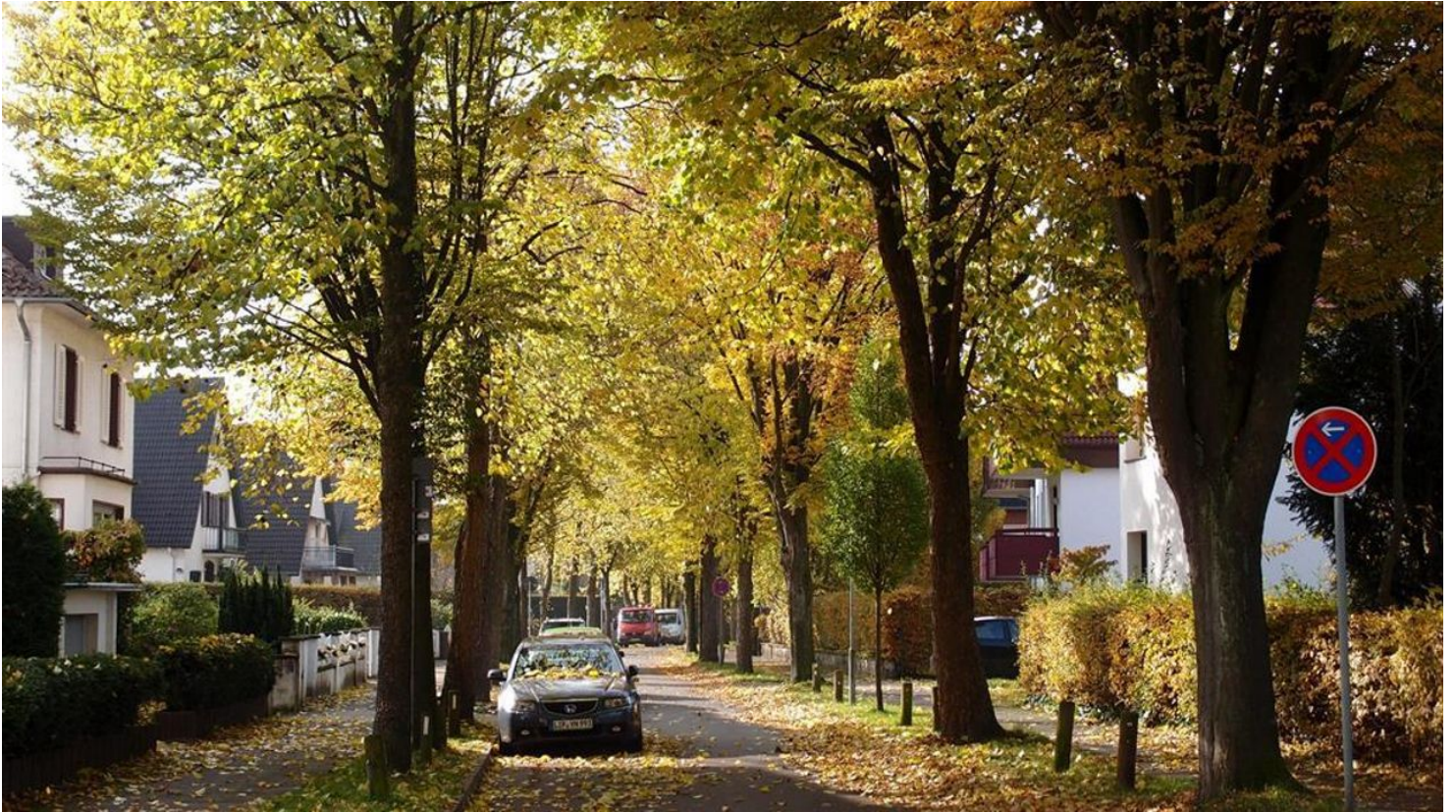
Impression Straße