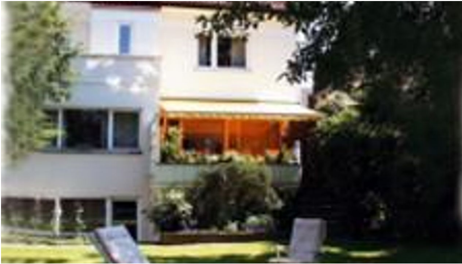
Hausansicht - © Haus Mingers