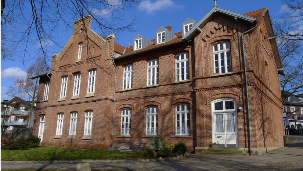
Hausansicht 2