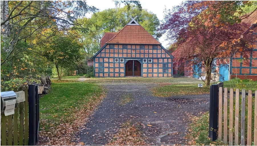
Kiwi Lodge - Modernes Urlaubsdomizil im alten Gewandt