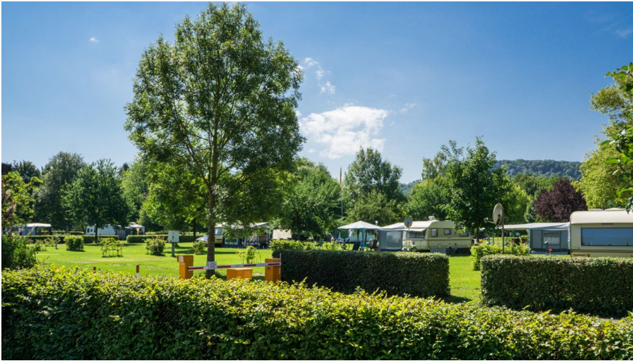
Campingplatz Siersburg