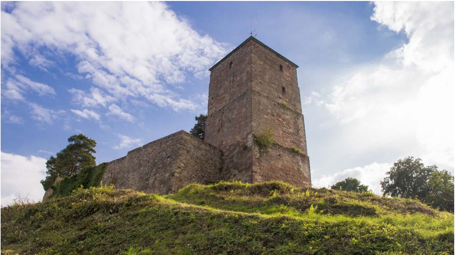
Burg Siersberg

Gesamtausstattung bzw. Gesamteindruck mit gutem Komfort. Einrichtungen von besserer Qualität.