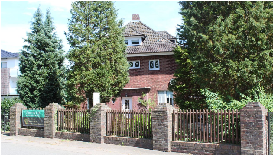
FeWo Villa Paula, Petershagen