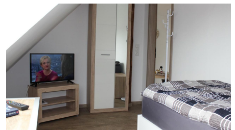
FeWo Schönenbusch - Schlafzimmer