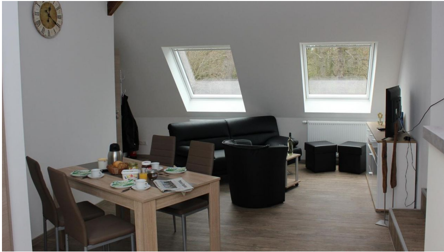
FeWo Schönenbusch - Essbereich-Wohnzimmer