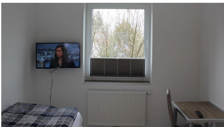
FeWo Schönenbusch - Schlafzimmer 2