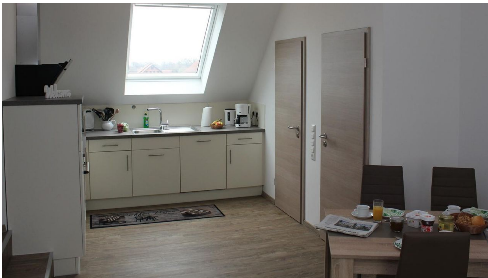
FeWo Schönenbusch - Essbereich-Küche