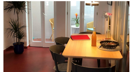
Charmantes Fachwerkhaus - Küche