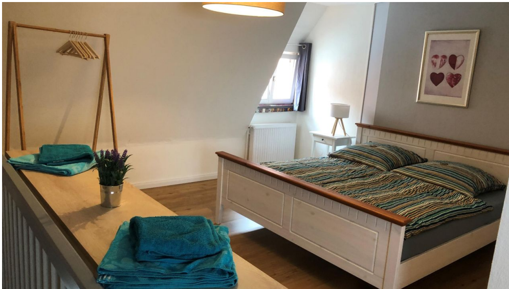
Charmantes Fachwerkhaus - Schlafzimmer