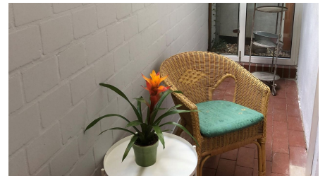
Charmantes Fachwerkhaus - Balkon