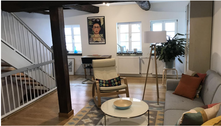
Charmantes Fachwerkhaus - Wohnraum