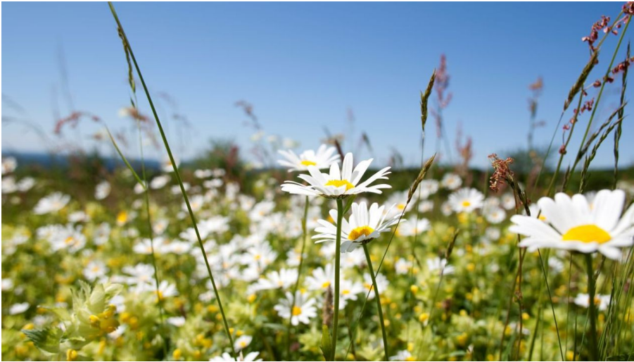
Frühling im Saarland