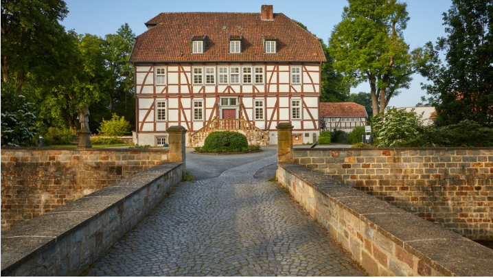
Borchen-Mallinckrothhof-Teutoburger-Wald-Tourismus-T-Evers-123-CC-BY-SA.jpg - © Teutoburger Wald Tourismus / T. Evers, Tanja Evers