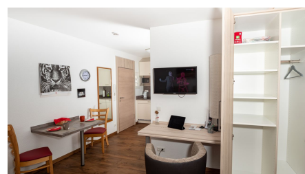
Apartment Alme_Raum.jpg