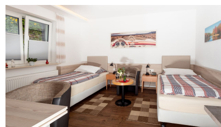
Apartment Alme_Schlafen.jpg