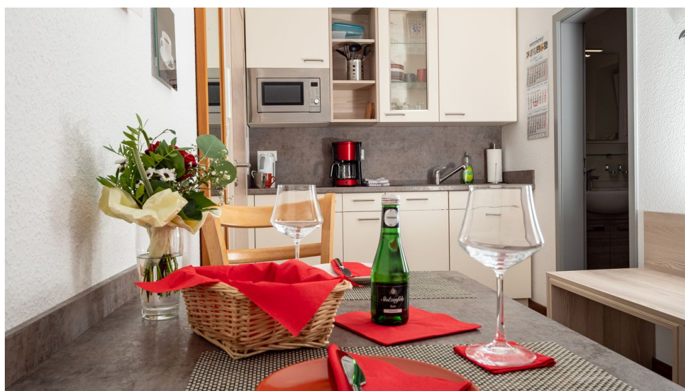
Apartment Alme_Essbereich.jpg

kostenlose Parkmöglichkeiten direkt am Haus