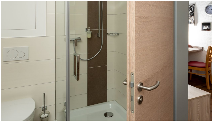
Apartment Alme Bad