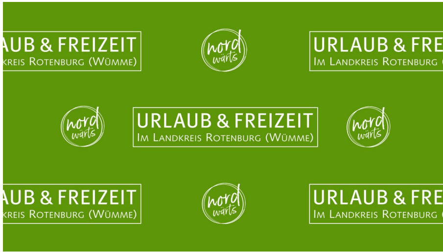
nordwärts - Urlaub und Freizeit im Landkreis Rotenburg (Wümme)