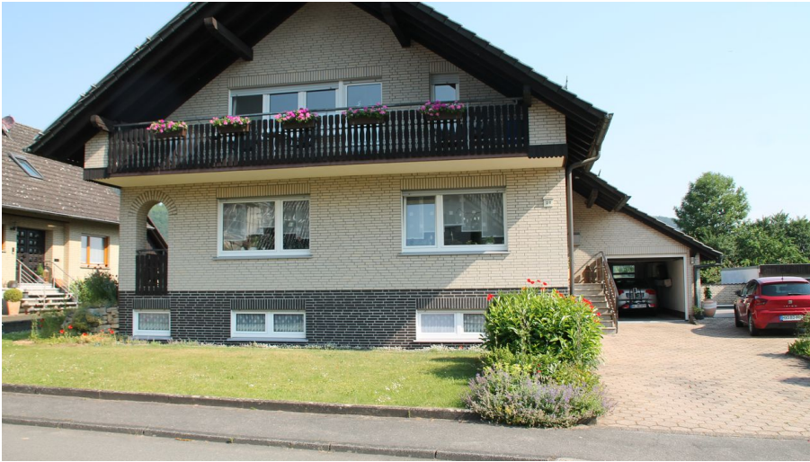
app_diedrich_Wohnhaus in der Burgfeldstrasse.JPG