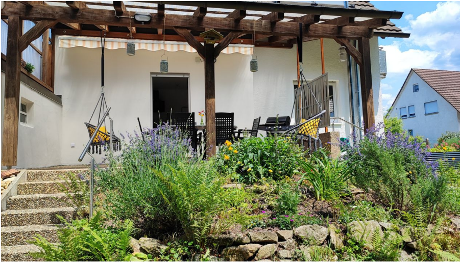
INSIDE, OUTSIDE - © tomas