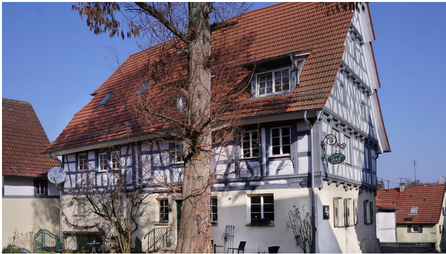
Stevenson House Aussenansicht