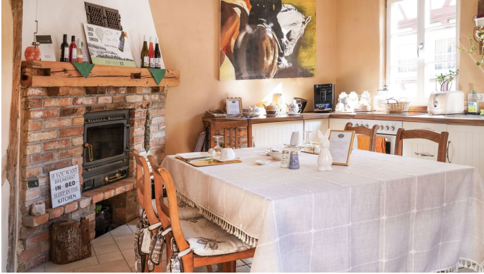
Stevenson House Küche