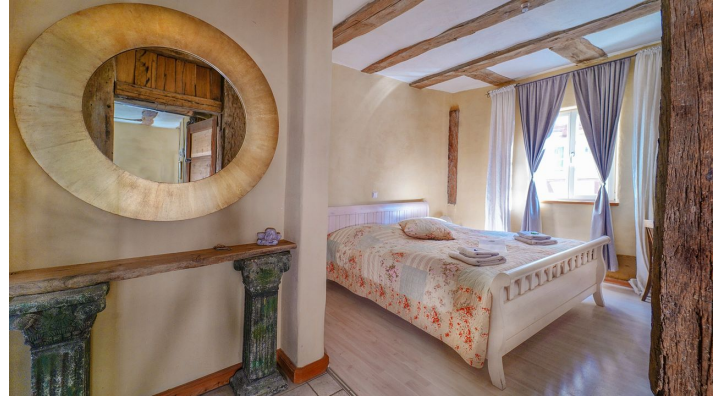
Stevenson House Zimmer