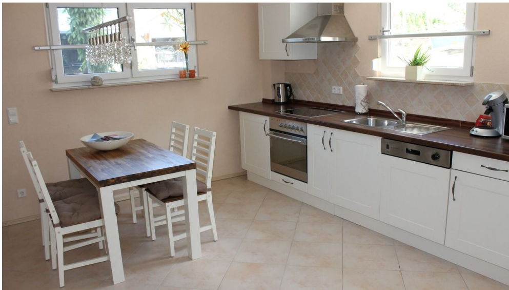
Ferienwohnung Schmidt, Küche Ansicht 2, Zaberfeld