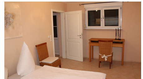
Ferienwohnung Schmidt, Schlafzimmer, Zaberfeld