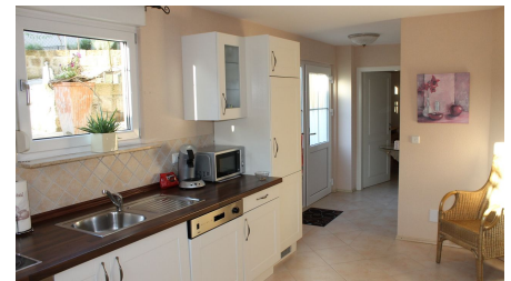
Ferienwohnung Schmidt, Küche, Zaberfeld