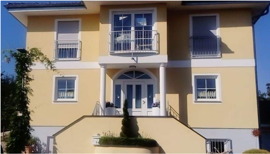
Ferienwohnung Schmidt, Außenansicht