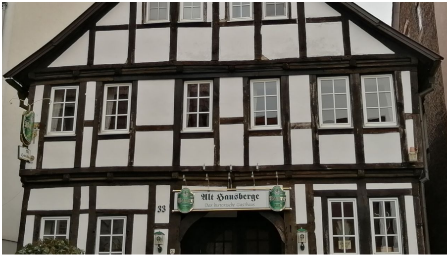
Alt Hausberge, Außenansicht