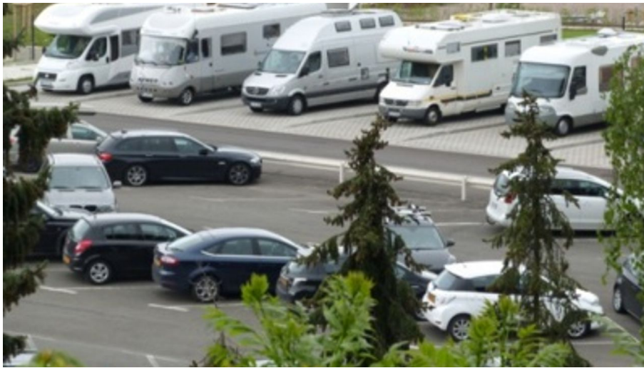
Wohnmobilstellplatz Atta-Höhle