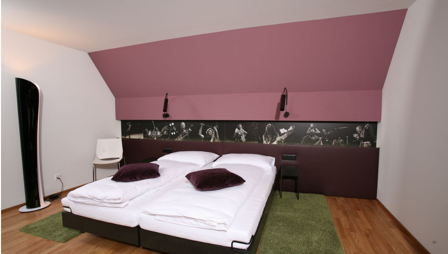
Hotel zum Mohren Willisau