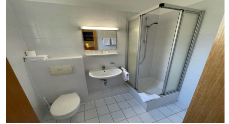
Hotel Papp-Mühle Badezimmer