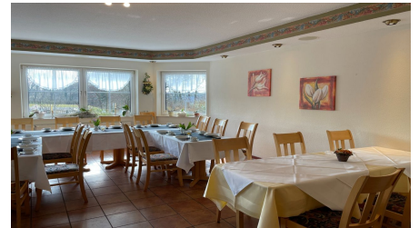
Hotel Papp-Mühle Frühstücksraum