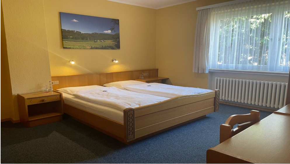
Hotel Papp-Mühle Zimmer