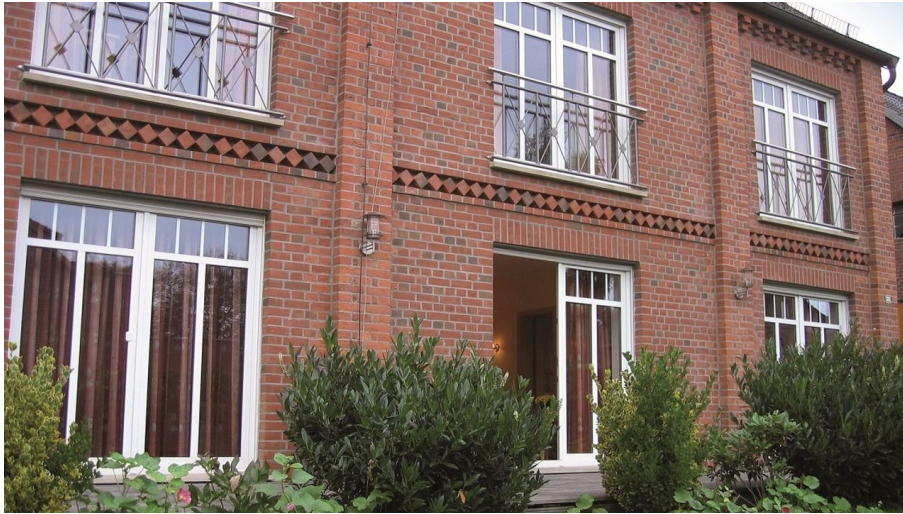
Gästehof Rinne