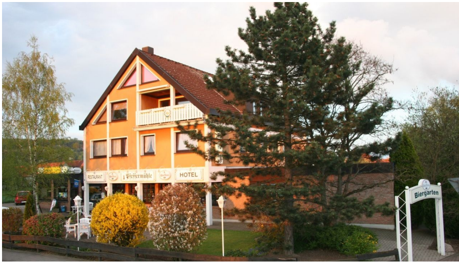
Hotel Pfeffermuehle