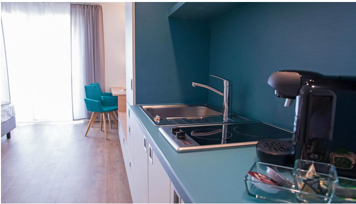
Boardinghouse am Teuto Lengerich-Küchenzeile.jpg