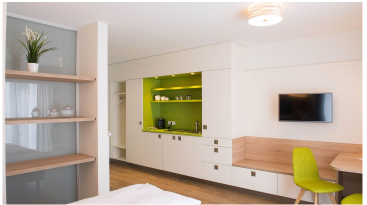
Boardinghouse am Teuto Lengerich-Zimmer.jpg