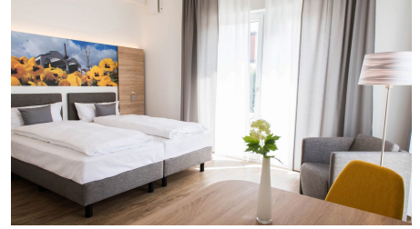
Boardinghouse am Teuto Lengerich_Doppelzimmer (5).jpg