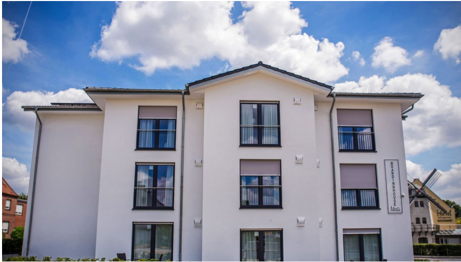
Boardinghouse am Teuto Lengerich