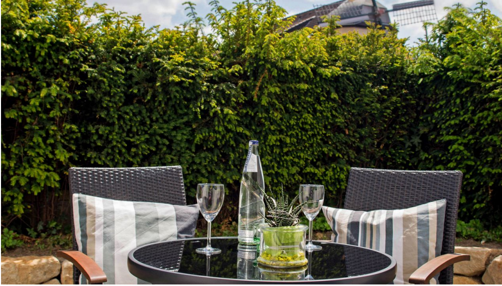
Boardinghouse am Teuto Lengerich -Terrasse.jpg