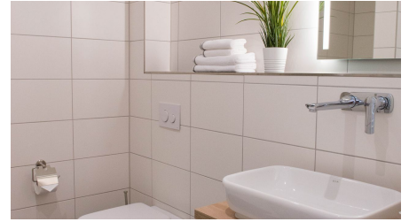
Boardinghouse am Teuto Lengerich-Bad.jpg