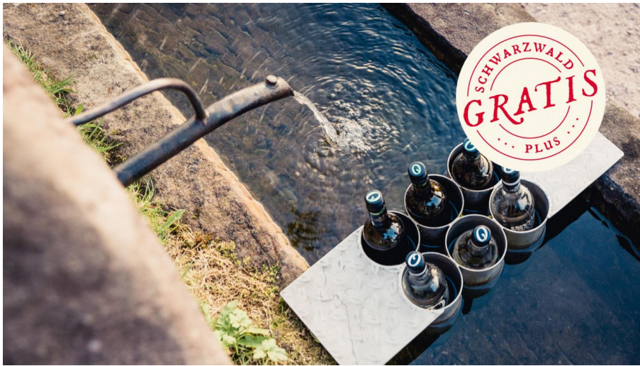
Weinbrunnen in Schwarzenberg