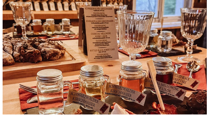
Passende Foodpairings zu den Destillaten