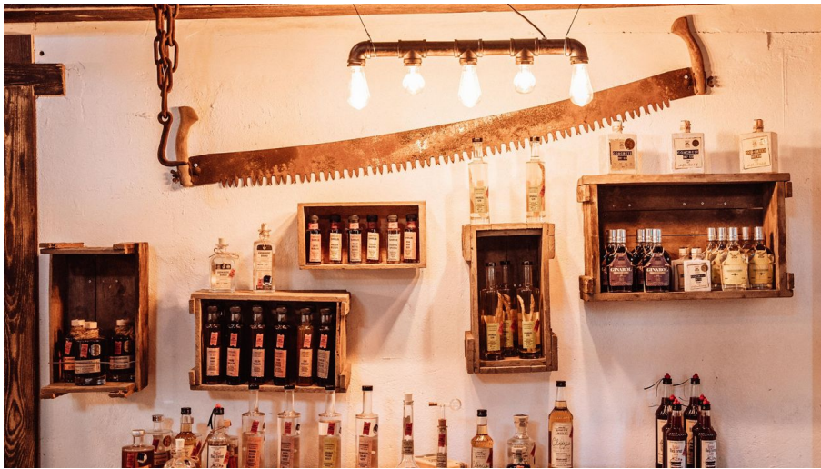
Großes Sortiment von SCHRAY´S DISTILLERY - © Baiersbronn Touristik/Max Günter