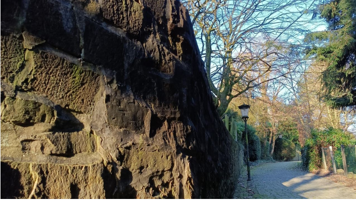
Stadtmauer BS