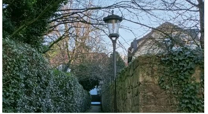
Gasse Stadtmauer BS