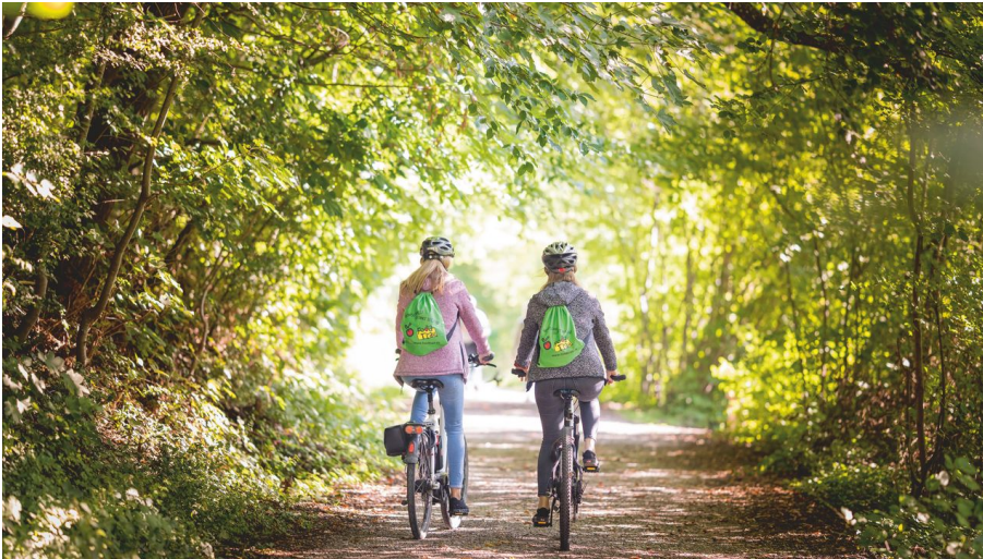
E-Bike FoodTrail