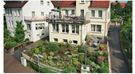
Havergoh Wander- & Fahrrad-Hotel Außenansicht