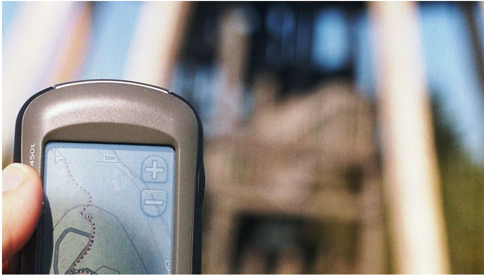
GPS Oregon 450-t