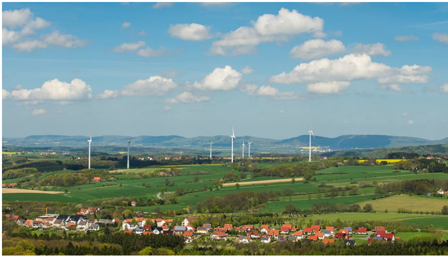
Ausblick Lippe