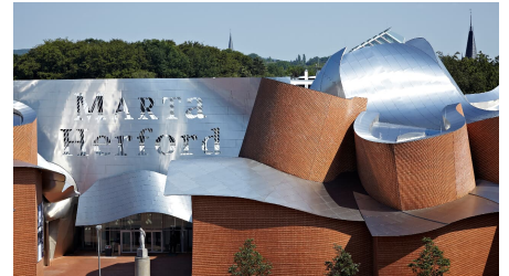
Marta Herford