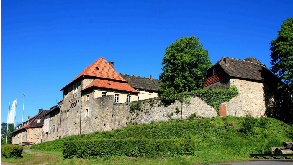
Burg Sternberg