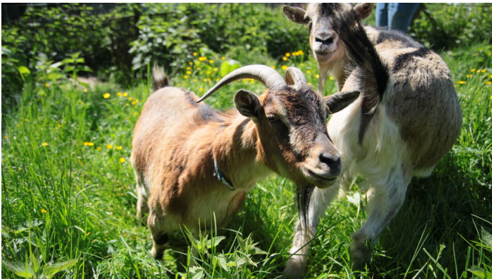
Ziegen im Dorf der Tiere