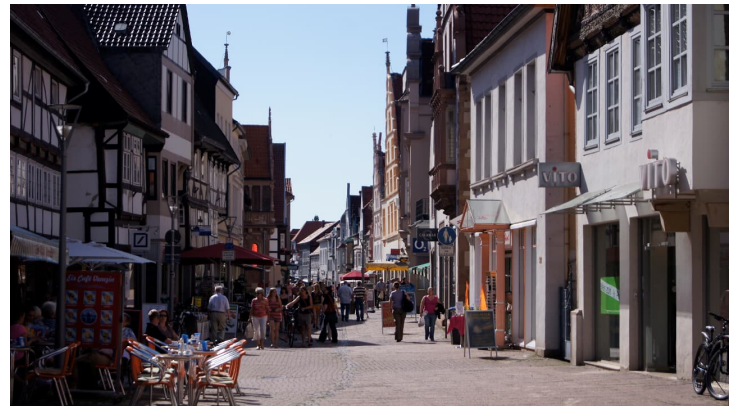
Fußgängerzone Lemgo