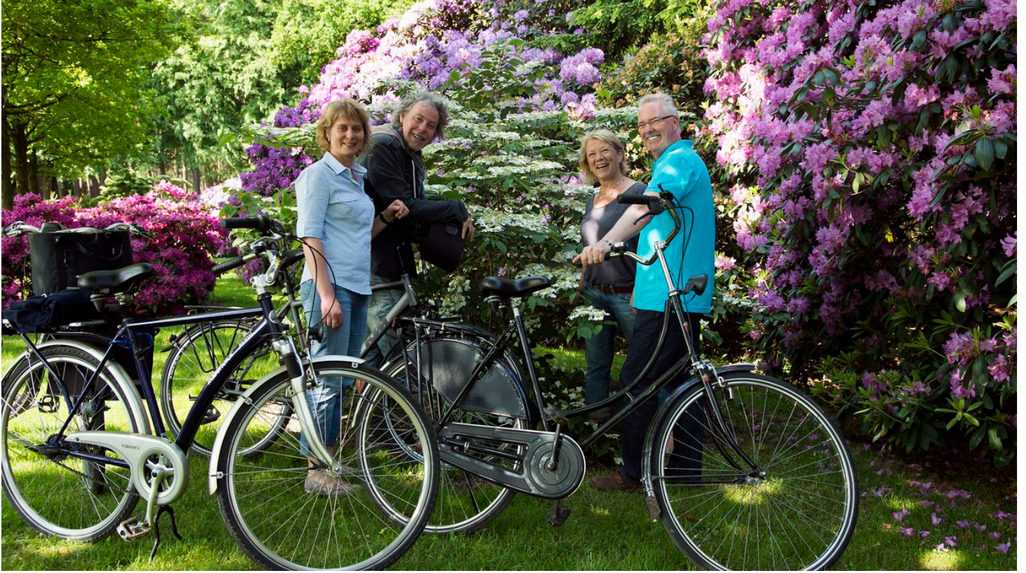
_ebr1633 - © reinsch-fotodesign_www.reinsch-fotodesign.de, Ekkehart Reinsch