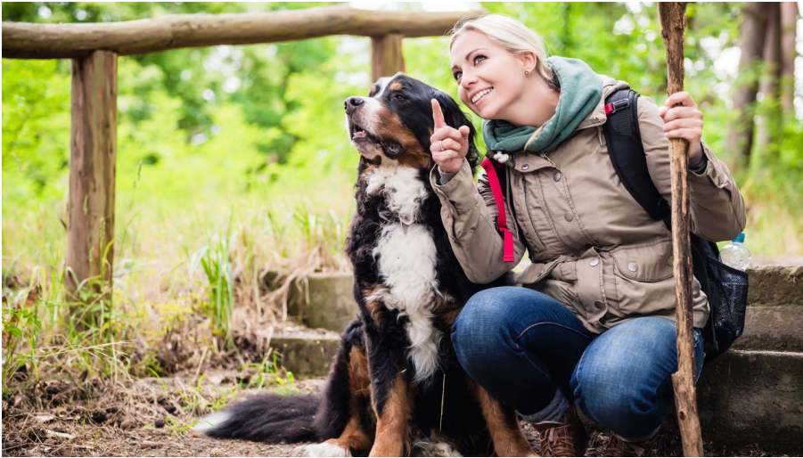
Mit Hund unterwegs