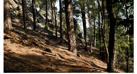
Wald bei Dörenther Klippen