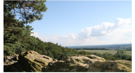
Aussicht Plisseetal