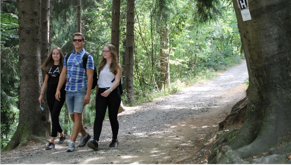
Wandern an den Dörenther Klippen