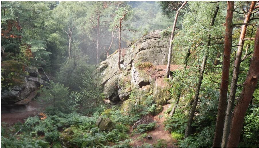
Verwünschte Dörenther Klippen