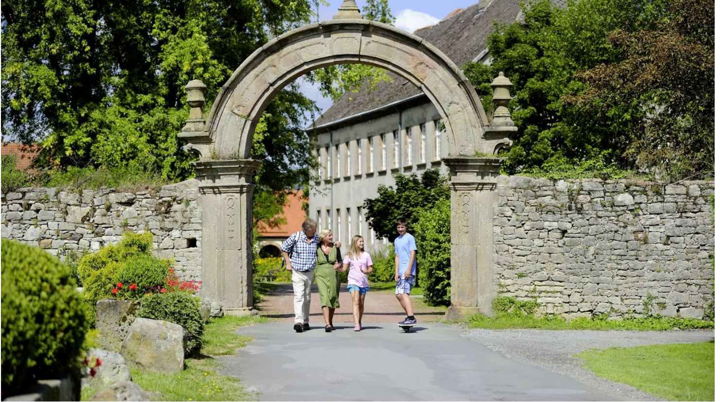
Willebadessen, ehemaliges Kloster - © Kulturland Kreis Höxter, I. Jansen, Smith & Jansen Visuelle Kommunik