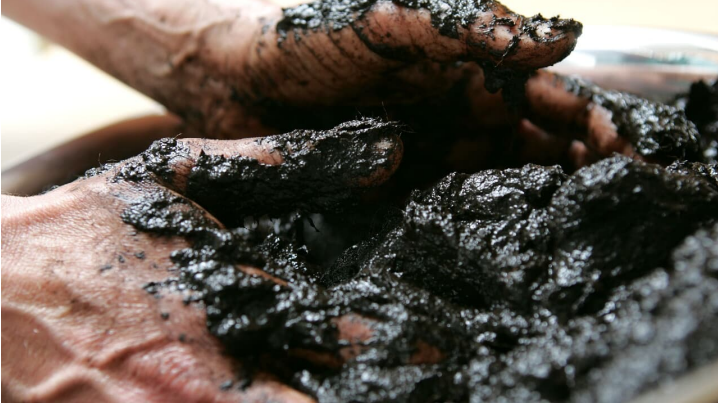
Hand voll Moor