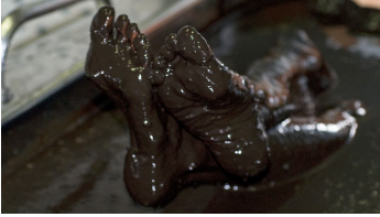
Moorfüße in der Wanne