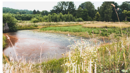
Moorleiche Gräflicher Park Bad Driburg