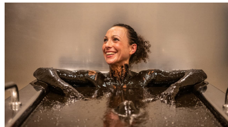
Bad Driburg-Gräflicher Park-Moorbad-Teutoburger-Wald-Tourismus-D-Ketz-038.jpg