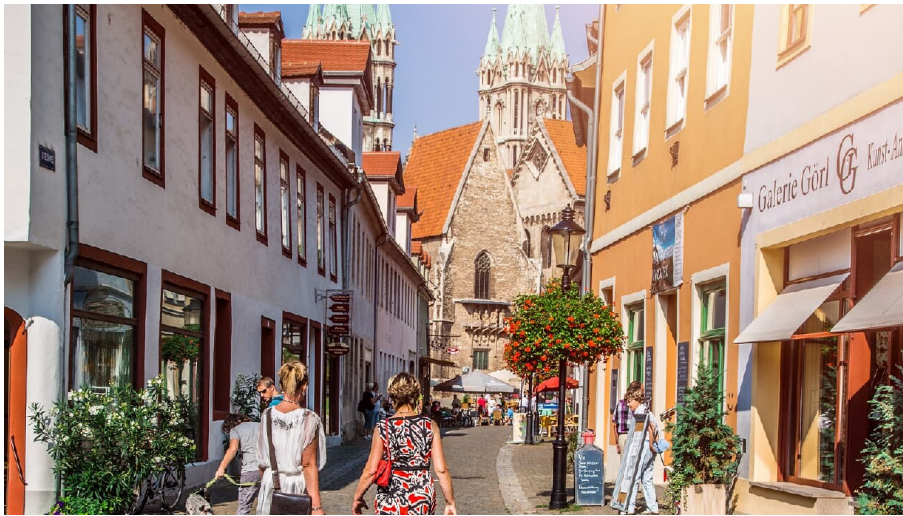
steinweg-in-naumburg - © Transmedial