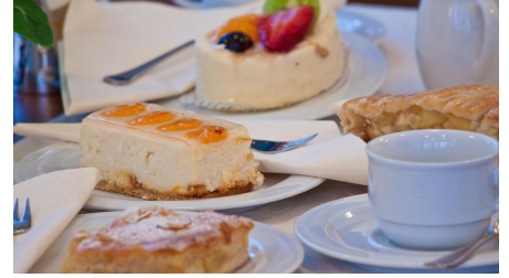
Kuchenangebot Gästehaus Havergoh - © mediadesign:janfuhrrottLanger Weg 6a33100 Paderborn, Jan Fuhrrott