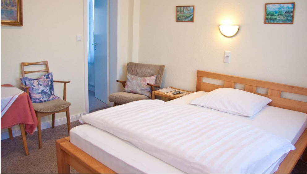
Zimmer im Gästehaus Havergoh