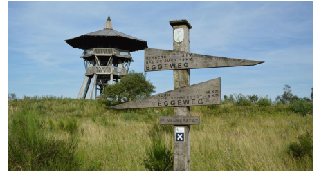
Eggeturm Preussische Velmerstot