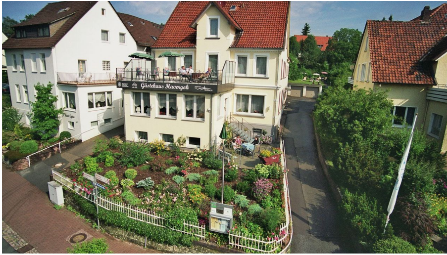
Fahrrad- und Wanderhotel Gästehaus Havergoh